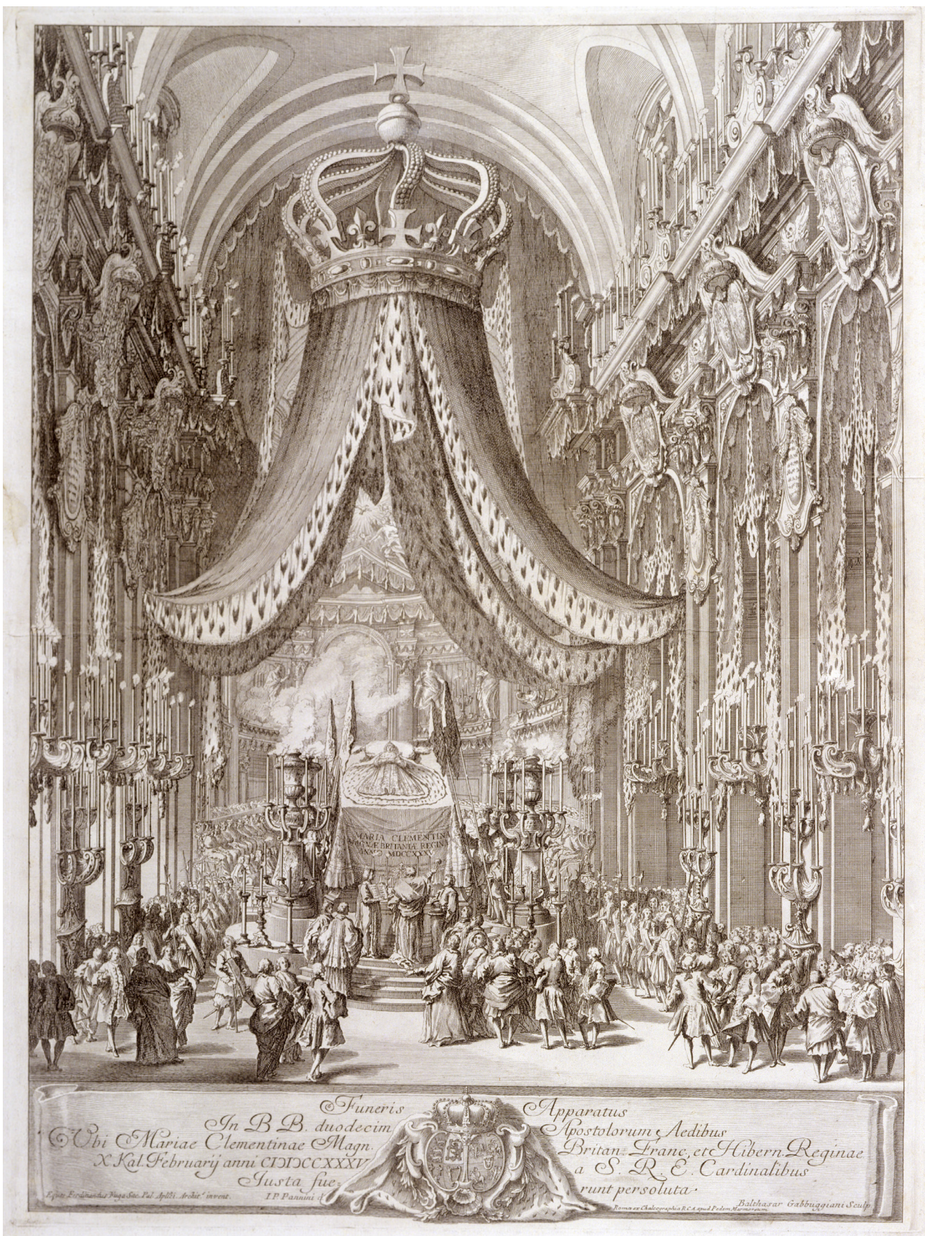
Tav. 3, b. Ferdinando Fuga, Giovanni Paolo Pannini, Baldassar Gabbugiani, Chiesa dei Santi Apostoli addobbata per le esequie della Regina della Gran Bretagna Maria Clementina Sobieska, acquaforte, 1735.