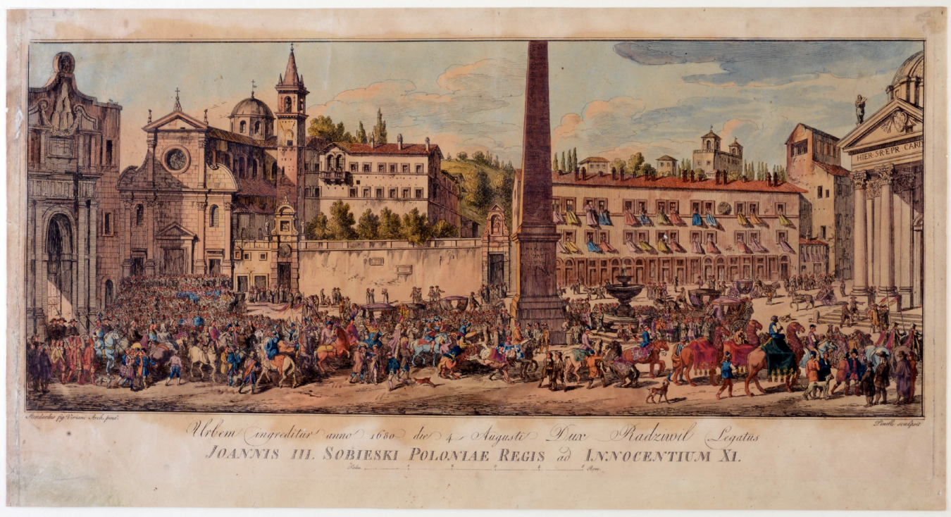
Tav. 1, a. Bartolomeo Pinelli, Solenne ingresso a Roma dell'ambasciatore di Polonia nel 1680, acquaforte, 1835.