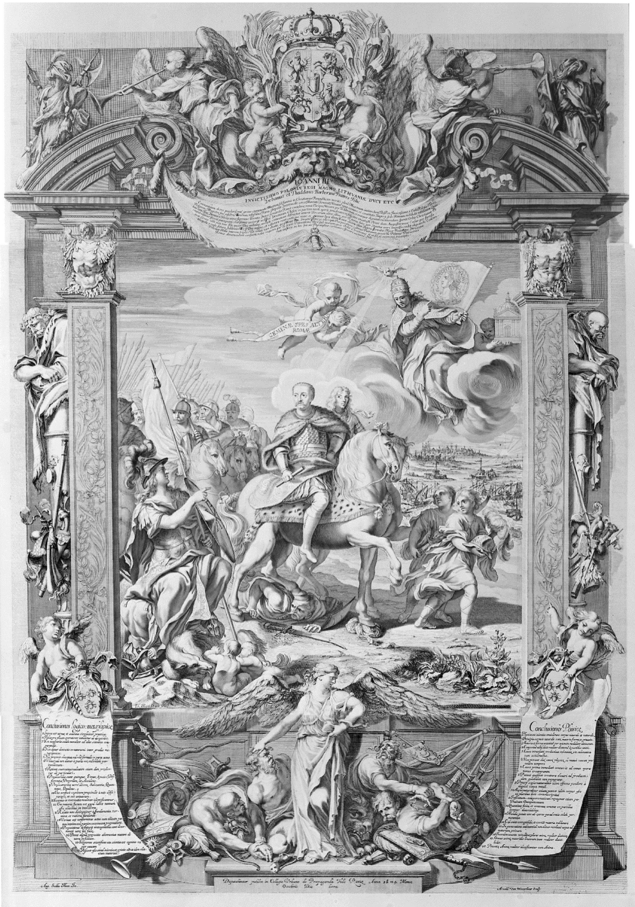
Tav. 2, a. Agostino Scilla, Jacques Blondeau, Apoteosi di Giovanni III Sobieski re di Polonia: il trionfo del Sovrano, vincitore dei Turchi, acquaforte in 3 parti, 1684.