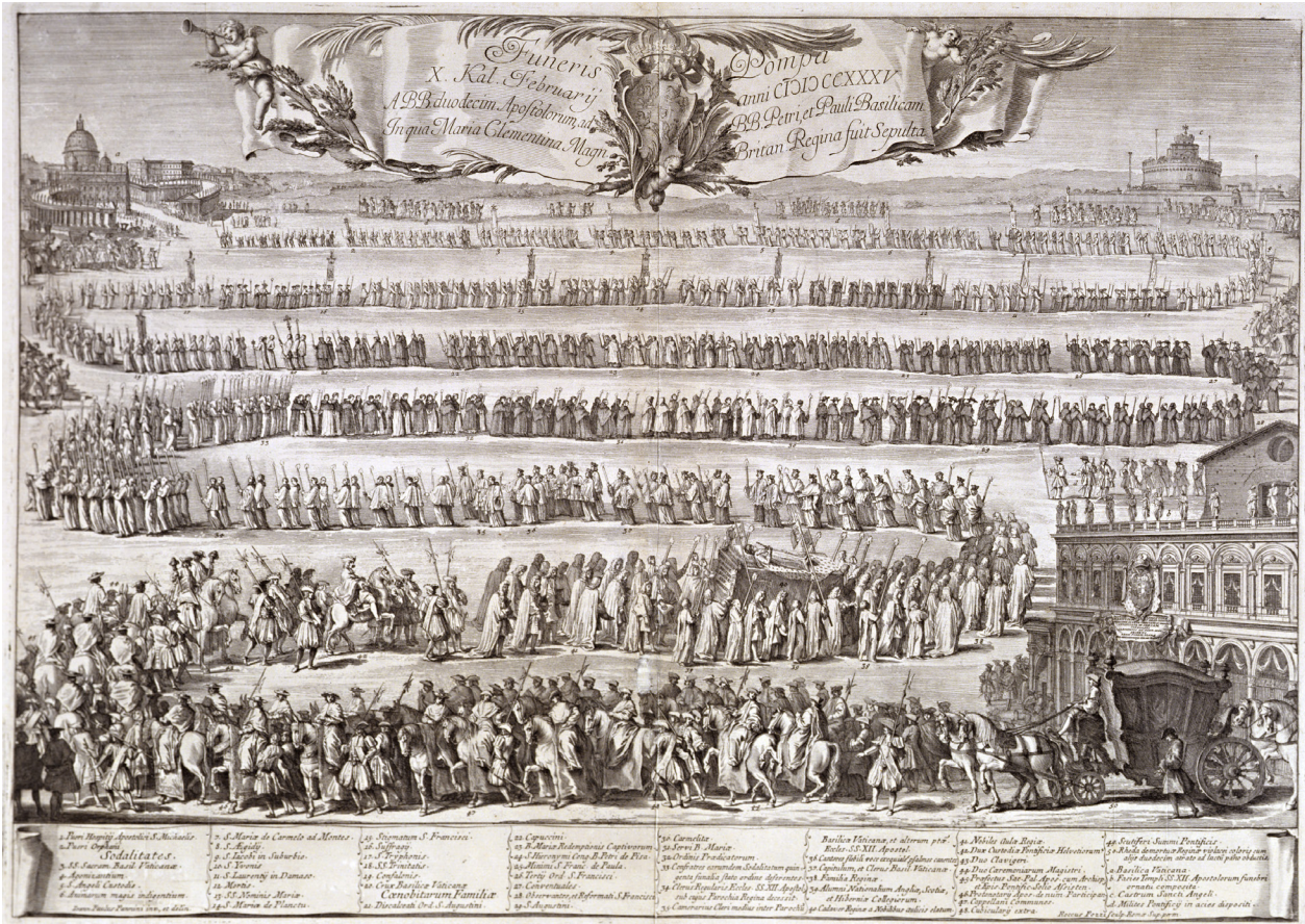
Tav. 4, b. Giovanni Paolo Pannini, Rocco Pozzi, Corteo funebre di Maria Clementina Sobieski dalla chiesa dei Santi Apostoli alla Basilica di San Pietro, acquaforte, 1735.