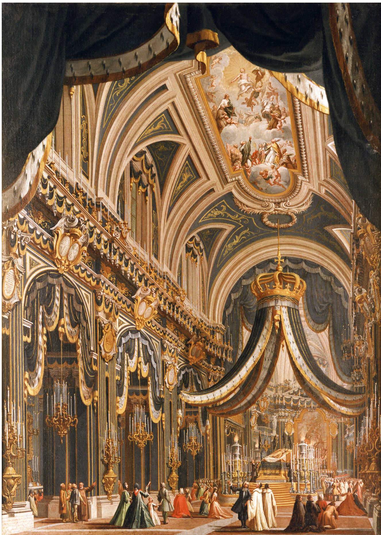
Tav. 4, a. Giuseppe e Domenico Valeriani, Funerali di Maria Clementina Sobieska Stuart nella chiesa dei SS. Apostoli, olio su tela, 1735 circa.