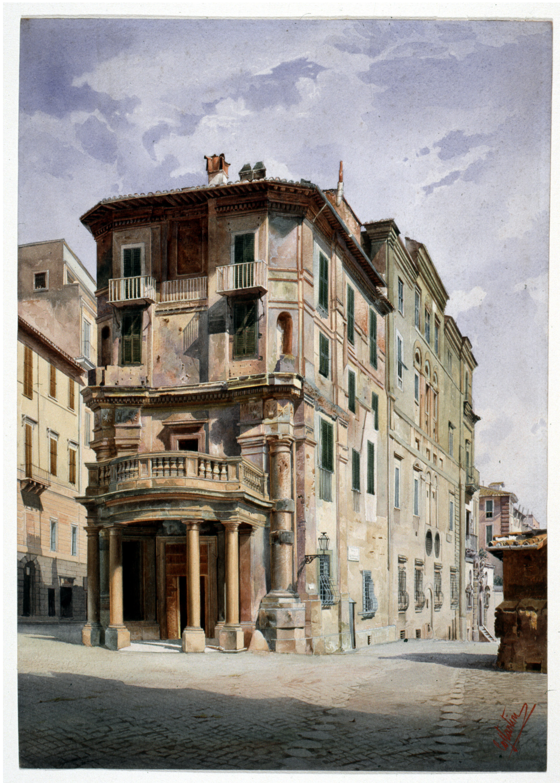
Tav. 5, b. Costantini (?), Palazzo Zuccari a Trinità dei Monti, acquerello su cartoncino, inizi XX sec.?.