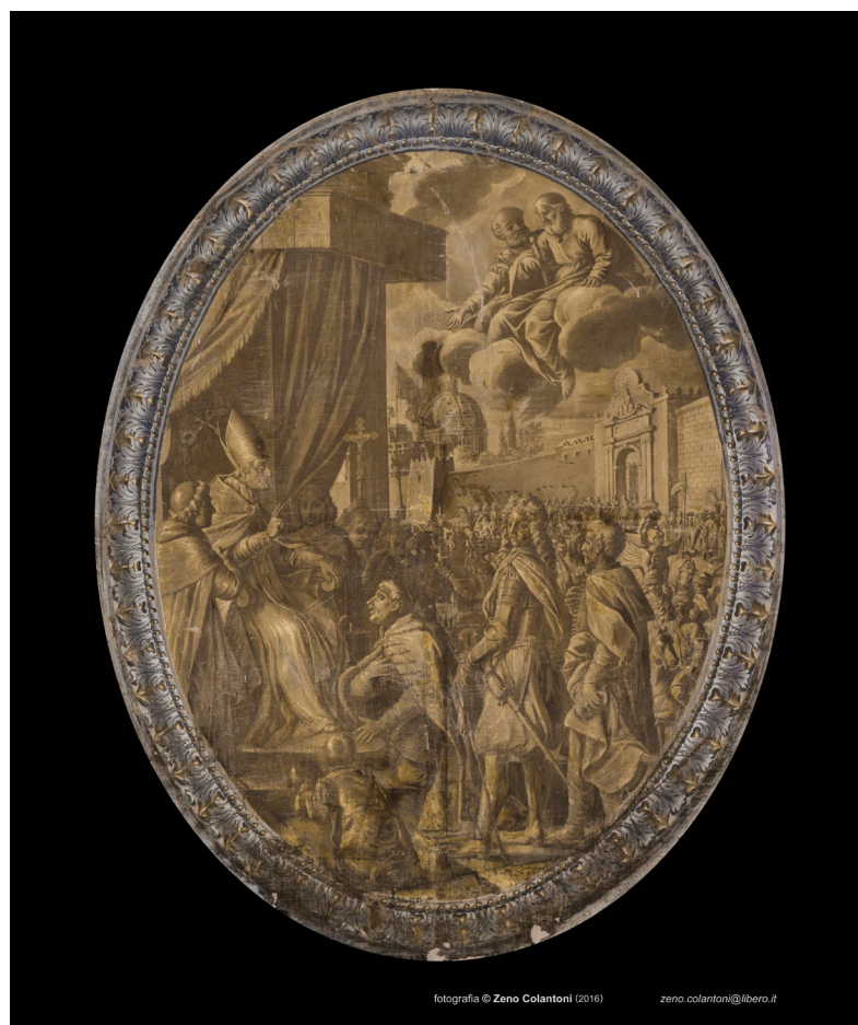
Tav. 1, b. Philipp Jakob Wörndle, L'obbedienza manifestata da Jan III Sobieski al Papa Innocenzo XI tramite il suo ambasciatore Michał Radziwiłł, tempera/grisaille su tela (per gentile concessione delle Gallerie Nazionali di Arte Antica (MIBACT) - Foto ©Zeno Colantoni).