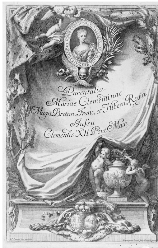
Tav. 5, a. Gian Paolo Panini, Giovanni Girolamo Frezza, Frontespizio con ritratto di Maria Clementina Sobieski, putti e simboli regali, acquaforte, 1736.